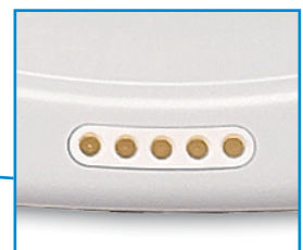
Induktion Laden ohne Kabel