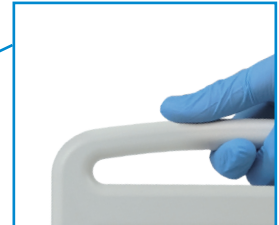
Praktischer Griff Verschafft Mobilität