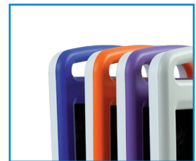
Farbvielfalt Blau, Orange, Lila, Weiß, Grau